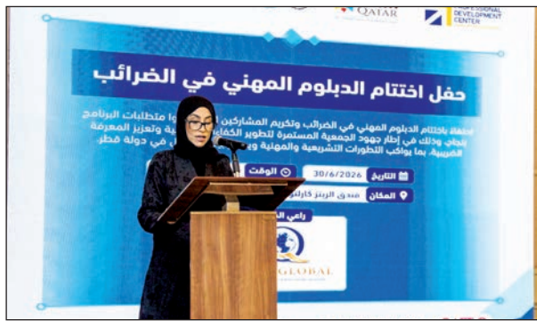
خلال حفل الاختتام

اختتمت جمعية المحاسبين القانونيين القطرية دبلوم الضرائب المهني الذي أطلقته بالتعاون مع مركز التطوير المهني بالجامعة الوطنية للمالية - قطر. وركز الدبلوم على تأهيل الكوادر المهنية وتطوير معارفهم ومهاراتهم في الأنظمة والتشريعات الضريبية، وتعزيز قدراتهم على تطبيق أفضل الممارسات في مجال الضرائب بما يتوافق مع المتطلبات القانونية والمهنية. وقد صمم الدبلوم ليربط بين الجانب النظري والتطبيق العملي، بما يسهم في إعداد مختصين قادرين على مواجهة تحديات بيئة العمل بكفاءة واحترافية. وفي الحفل الختامي تفضل سعادة الدكتور سلطان الدوسري رئيس مجلس إدارة جمعية المحاسبين