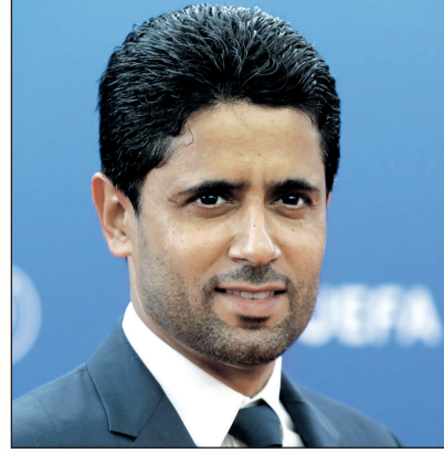
الأوروبية والدولية على اختلاف أحجامها.. ويسعدني كثيرا أن يشمل

وأضاف: «يؤكد هذا الاتفاق قوة الشراكة بين الأندية والمنتخبات الوطنية، في وقت تعمل رابطة أندية كرة القدم الأوروبية من أجل المصالح الجماعية لجميع أعضائنا وكذلك غير الأعضاء ضمن منظومة كرة القدم الممتدة على نطاق واسع.. وتؤدي الأندية دورا أساسيا في نجاح كرة القدم الدولية من خلال تطوير اللاعبين وتوظيفهم وتسريحهم، بينما تواصل كرة قدم المنتخبات دعم النمو العالمي لكرة القدم للأندية وتعزيز حضورها».