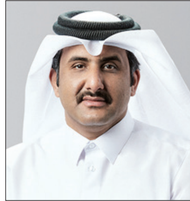
الشيخ فيصل بن عبدالعزيز