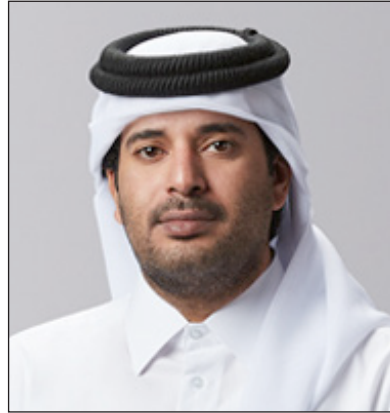
الشيخ فهد بن فلاح