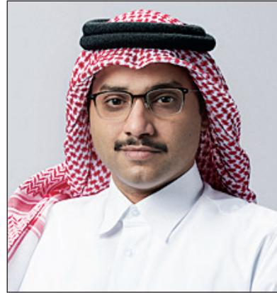
الشيخ جاسم بن محمد