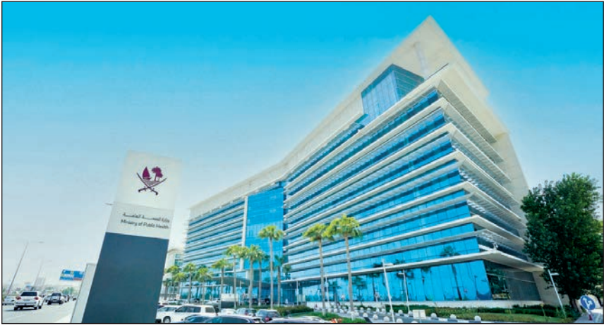
وزارة الصحة العامة