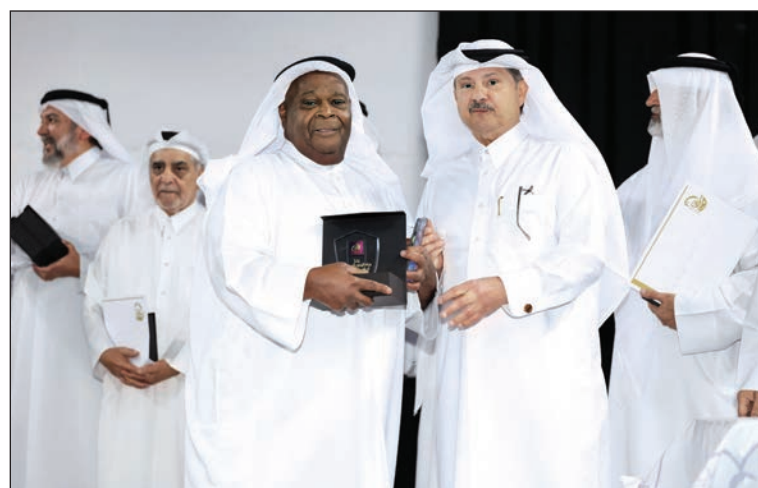
تكريم الفنان سعد بخيت