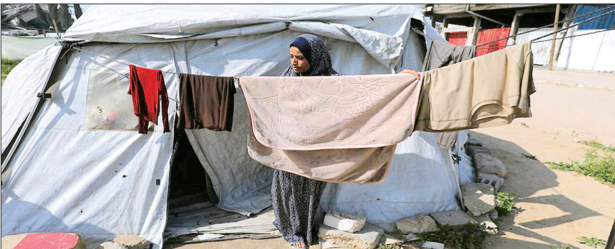
■ حياة بانسة في قطاع غزة بفعل الحصار الإسرائيلي