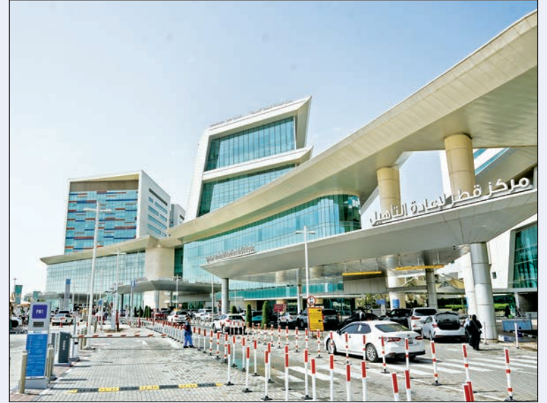
تنظيم أكثر بعملية دخول وخروج سيارات المراجعين والزوار

حركة مرورية سلسلة عند مداخل المراكز التابعة لـ «حمد الطبية»