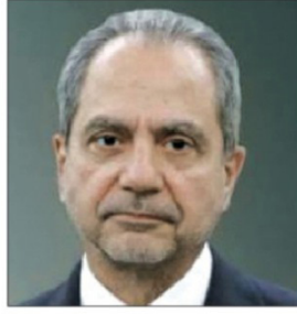
■ الوزير جواد الصفي