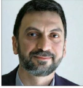
■ النائب إبراهيم منبممة