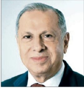
■ النائب عنان لطرابلسي