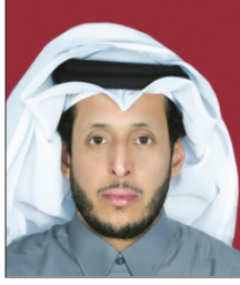
الشيخ د. سعود بن ناصر آل ثاني

إن فن تحطيم الكفاءات في كل زمان ومكان، ولا يكون إلا من الإدارة المريضة التي لا تطردك فحسب؛ بل هي أذكى من ذلك بكثير. فإن الطرد قرار قانوني قد يتبعه محاسبة، لكنها تفضل «التطفيش» الممنهج. حيث إنها تكافئ الفاشل وتدني منها المداهن، حتى يغدو الاجتهاد تهمة تطارد المخلص،