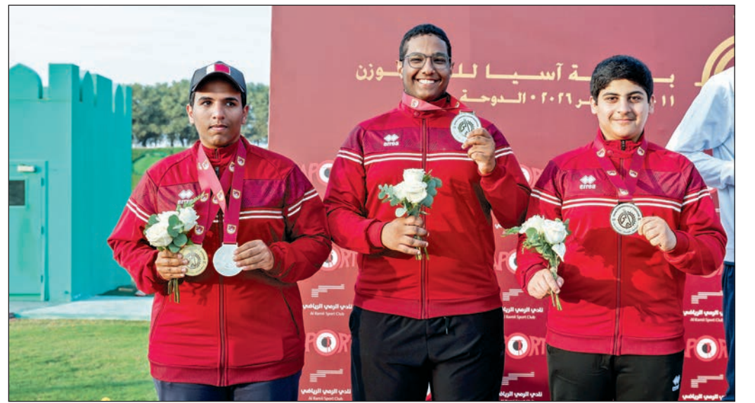
تتويج الفرق بالفضية