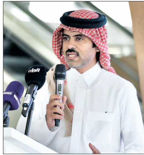
عبد الرحمن بن مسلم الدوسري، رئيس لجنة اليوم الرياضي للدولة