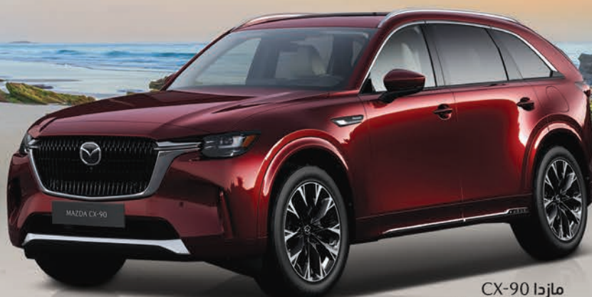
مازدا CX-90 HIGH PLUS GRADE