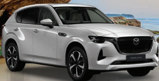
مازدا CX-60 HIGH GRADE