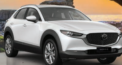
مازدا CX-30 HIGH GRADE