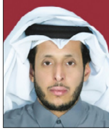
الشيخ د. سعود بن ناصر آل ثاني

كيف للإنسان أن يكون عالمة وقد أُنعِمَ عليه بالوجود؟ لقد خُلِقنا على هذه الدنيا لسبب واحد بالرغم من اختلافاتنا لمفهوم الوجود واختلاف تحديد وجهتنا فيها. وكلنا نسأل عما نكون وماذا نُريد من هذه الحياة. ومن الممكن أن نُغيّر أو أن نتغير بسبب العوامل والأحداث والأشخاص المؤثرين والمتأثرين بنا.