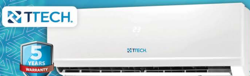
مكيف تي-تك ٢.٥ طن T-TECH AC 2.5 TON