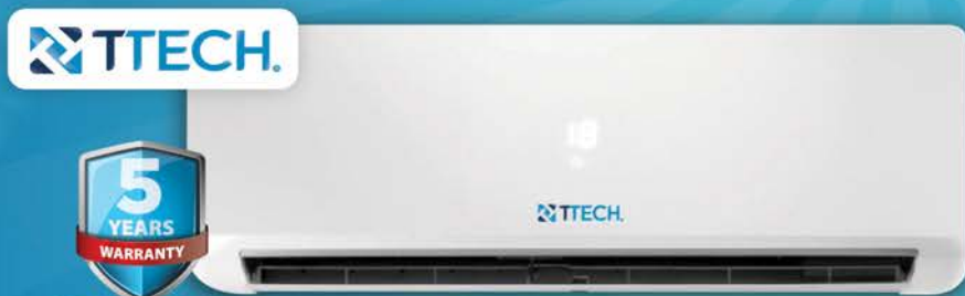
مكيف تي-تك ٢ طن T-TECH AC 2 TON