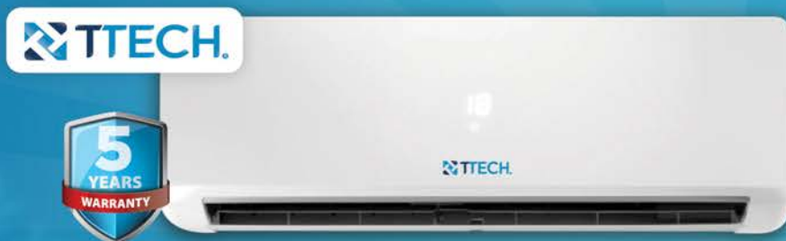
مكيف تي-تك 1.0 طن T-TECH AC 1.5 TON