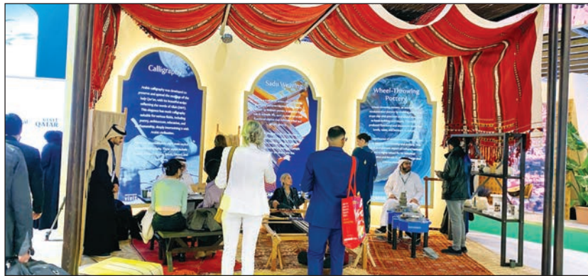
■ جانب من الجناح القطري

العالم، مضيئة قائلة يضم الجناح القطري هذا العام مجموعة متميزة من الجوانب التراثية والثقافية في قطر، حيث يتواجد لديها 15 مكتبا في معظم دول العالم للتعريف بقطر والتطورات التي حققتها من حيث البنية التحتية وجاهزيتها لاستقبال الفعاليات والمؤتمرات الدولية وايضاً تقدم هذه المكاتب بالتعريف بالثقافة العربية والخليجية في دول