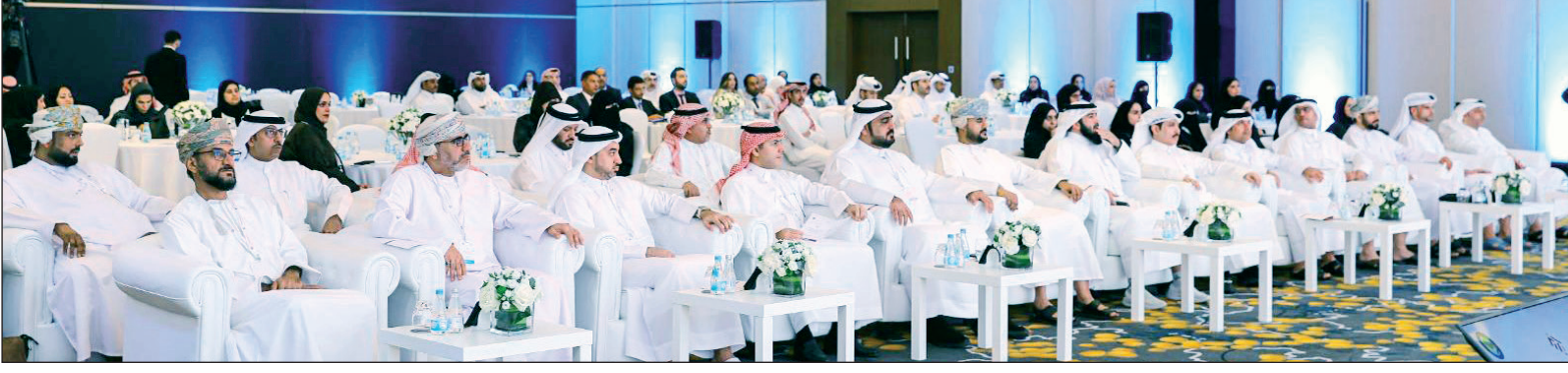
■ جانب من الحضور

نظمت المؤسسة العامة القطرية للكهرباء والماء "كهراء" وبالتنسيق مع الأمانة العامة لمجلس التعاون لدول الخليج العربية، المنتدى الخليجي السادس لخدمات المشتركين في قطاع الكهرباء والماء بدول مجلس التعاون. شهد المنتدى مشاركة كبيرة من الجهات المعنية ومقدمي الخدمات من مختلف دول مجلس التعاون الخليجي، والذي يعكس أهمية هذا المنتدى في تعزيز التعاون على مستوى المنطقة. يهدف المنتدى بشكل رئيسي إلى تبادل الخبرات والتجارب في مجال خدمات الكهرباء والماء ومناقشة أحدث التطورات والتحديات التي تواجه هذين القطاعين في دول الخليج، كما يسعى إلى رفع مستوى جودة الخدمات المقدمة للمشاركين، وتحسين تجربتهم من خلال تبني أفضل الممارسات التي تضمن حقهم في الحصول على خدمات موثوقة وذات جودة.