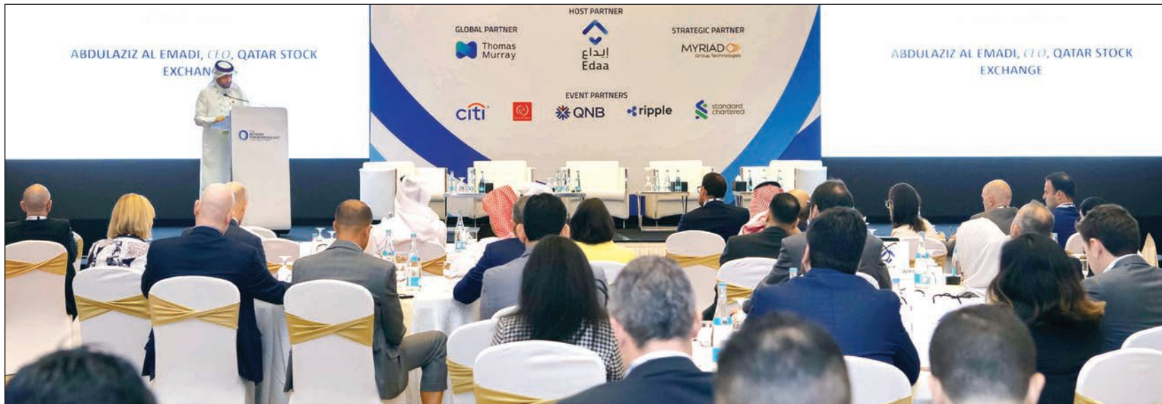
■ خلال المنتدى

وأشار إلى أن هذه الجهود تتماشى مع رؤية قطر الوطنية الطموحة للعام 2030، واستراتيجية مصرف قطر المركزي الثالثة للقطاع المالي، التي تضع الأسس لاقتصاد مبتكر ومتعدد المصادر ومستدام. وتابع قوله: "نحن جميعاً على علم بأن المستثمرين الدوليين يركزون بشكل متزايد على منطقتنا، بفضل الاستقرار والفرص الاستراتيجية والالتزام بالابتكار الذي توفره دول مجلس التعاون الخليجي". وأوضح مساعد المحافظ للأدوات المالية ونظم الدفع أنه يتم العمل بجد لضمان أن البنية التحتية المالية تفي بأعلى المعايير العالمية، وخاصة من خلال تقليص دورة التسوية، مبرزاً أن شركة "إيداع"،