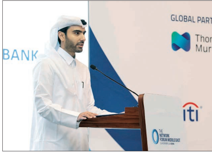
■ الشيخ أحمد بن خالد

وبناقش المشاركون في جلسات المنتدى على مدار يومين مجموعة من أبرز القضايا لتشمل تعزيز الوصول إلى الأسواق للمستثمرين الدوليين في منطقة الخليج، وتسريع دورات التسوية، والابتكارات الجديدة في مراكز الإيداع والتسوية، وإعادة تعريف معايير الحوكمة البيئية والاجتماعية، وأثر الذكاء الاصطناعي على الأسواق المالية، إلى جانب محاور أخرى تعنى بالأسواق الرقمية والذكاء الاصطناعي والمستنقعات المالية بمختلف أنواعها.