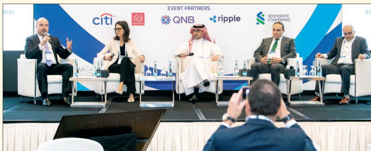
■ إحدى جلسات المؤتمر

وعلى مدار يومين، سيتبادل المتحدثون الأفكار حول أحدث الاتجاهات التي تشكل مستقبل التمويل وأسواق المال من خلال عدد من المحاور الرئيسية التي تشمل المتطلبات الرئيسية للمستثمرين الدوليين لأسواق دول مجلس التعاون الخليجي والشرق الأوسط؛ "تقصير دورة التسوية في أسواق المال العربية؛" تكنولوجيا دفاتر الحسابات الرقمية الموزعة؛ "الأصول الرقمية ومبادرات ترميز الأصول في العالم الحقيقي في دول مجلس التعاون الخليجي؛" تأثير الذكاء الاصطناعي على الصناعة؛ "إقراض الأوراق المالية في المنطقة؛" وقواعد ولوائح الأمن السيبراني، وغيرها من المواضيع العامة.