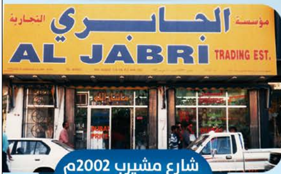
شارع مشيرب 2002م