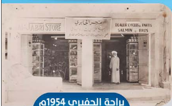
براحة الجفيري 1954م