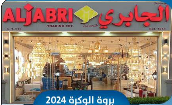
بروة الوكرة 2024