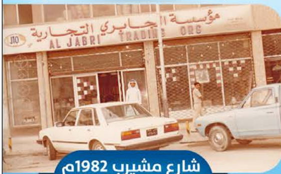
شارع مشيرب 1982م