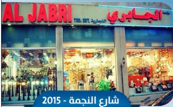
شارع النجمة - 2015