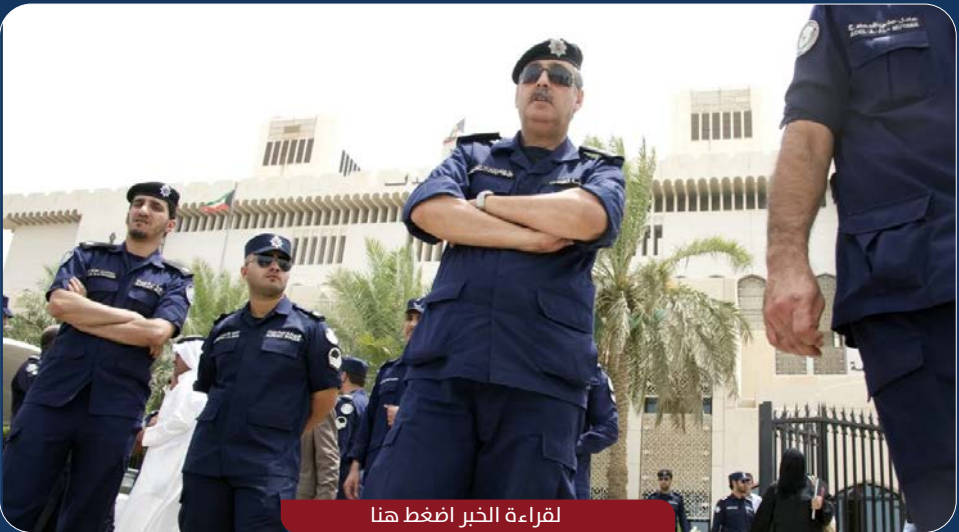
لقراءة الخبر اضغط هنا

قضت محكمة الجنايات في الكويت بحبس وافد مصري لمدة 20 سنة مع الشغل والنفاذ وتغريمه مليون دينار لارتكابه عدة جرائم.