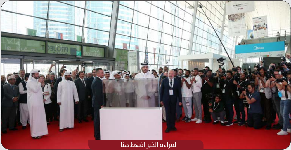
لقراءة الخبر اضغط هنا

افتتح سعادة الشيخ محمد بن حمد بن قاسم العبدالله آل ثاني وزير التجارة والصناعة، اليوم، المعرض التجاري الدولي التاسع عشر لمواد ومعدات وتقنيات البناء /بروجكت قطر 2023/، الذي يقام بمركز الدوحة للمعارض والمؤتمرات بدعم من وزارة التجارة والصناعة، وبالشراكة مع هيئة الأشغال العامة.