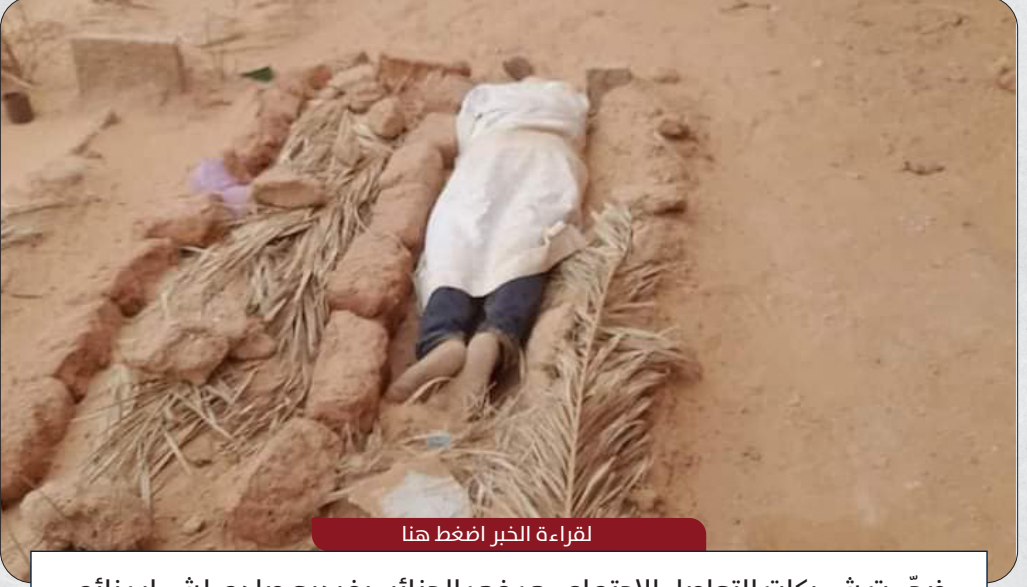
لقراءة الخبر اضغط هنا

فجّت شبكات التواصل الاجتماعي في الجزائر، بفيديو صادم لشاب نائم بجوار قبر أمه منذ سنتين حزنا على فراقها، ما أثار تعاطفا وردود فعل رسمية، بحسب صحيفة "الشروق" المحلية .