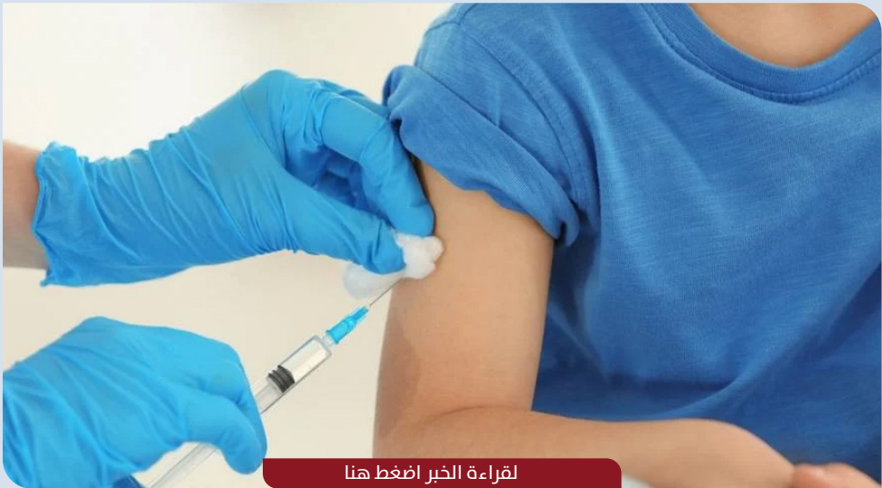
لقراءة الخبر اضغط هنا

تتيح وزارة الصحة العامة للأفراد خدمة إلكترونية للاطلاع على كافة التطعيمات التي يحتاجها الطفل وأين يمكنك الحصول عليها.