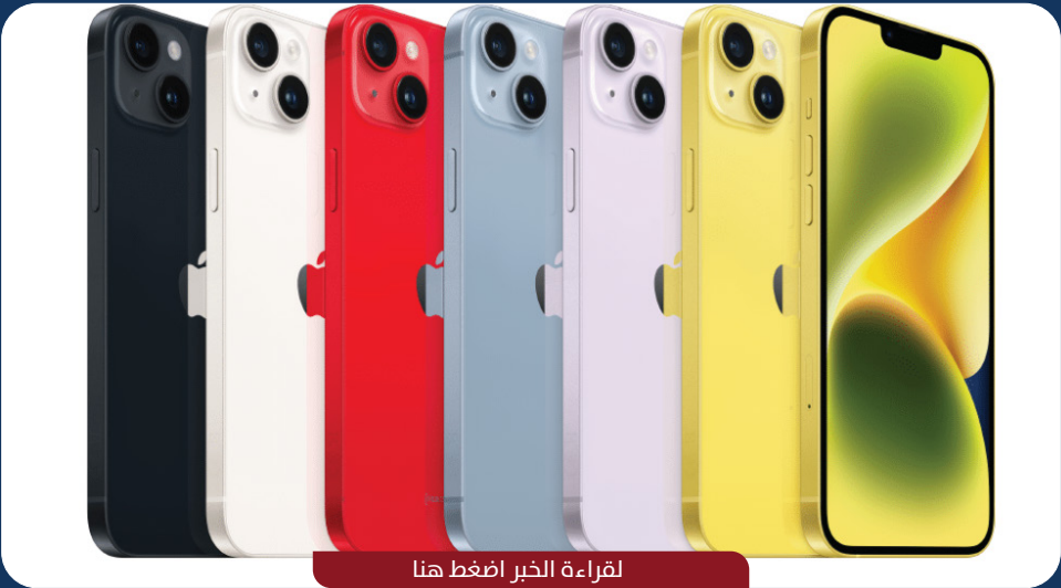
لقراءة الخبر اضغط هنا

أعلنت شركة أبل عن إغلاق خدماتها المجانية لحفظ الصور "My Photo Stream" في 26 يوليو المقبل، على أن يتم إيقاف إمكانية تخزين المستخدمين للصور على متن الخدمة في 26 يونيو.