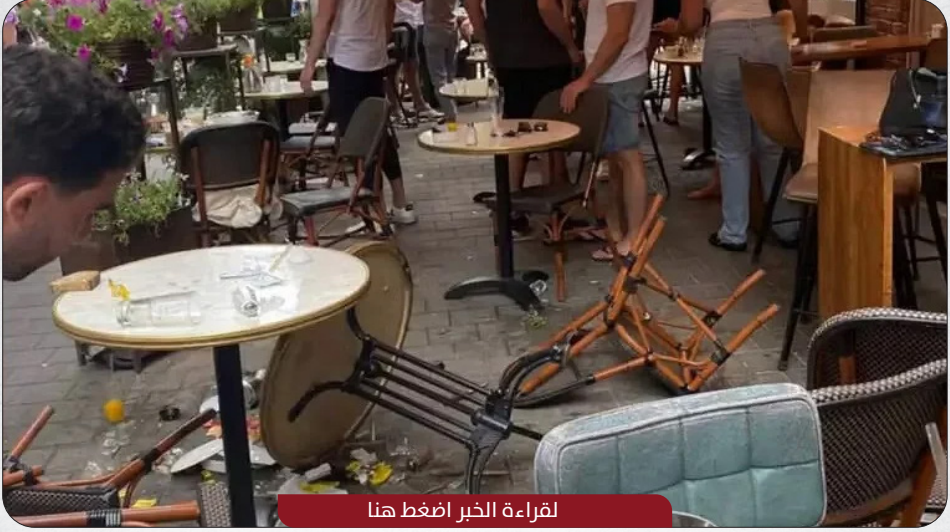
لقراءة الخبر اضغط هنا

حالة من الهستيريا والصراخ أصابت امرأة في مقهى إسرائيلي وسط "تل أبيب" وتثير الرعب والفوضى داخل المقهى ليظن المتواجدين بأن هناك هجوماً فدائياً ينفذه فلسطينيون، غير أنه تبين لاحقاً بأن المتسبب كان "صرصوراً".