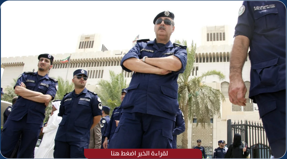
لقراءة الخبر اضغط هنا

قضت محكمة الجنايات في الكويت بحبس وافد مصري لمدة 20 سنة مع الشغل والنفاذ وتغريمه مليون دينار لارتكابه عدة جرائم.