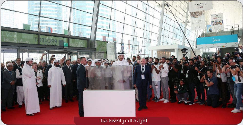
لقراءة الخبر اضغط هنا

افتتح سعادة الشيخ محمد بن حمد بن قاسم العبدالله آل ثاني وزير التجارة والصناعة، اليوم، المعرض التجاري الدولي التاسع عشر لمواد ومعدات وتقنيات البناء /بروجكت قطر 2023/، الذي يقام بمركز الدوحة للمعارض والمؤتمرات بدعم من وزارة التجارة والصناعة، وبالشراكة مع هيئة الأشغال العامة.