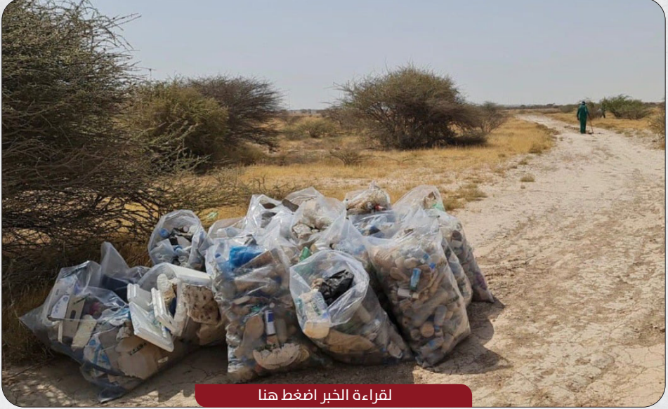
لقراءة الخبر اضغط هنا

أعلنت وزارة البيئة والتغير المناخي عن تنفيذ إدارة تنمية الحياة الفطرية بحملات تنظيف موسّعة بعدد من الروض لإزالة المخلفات وإعادة تأهيلها لحالتها الطبيعية.