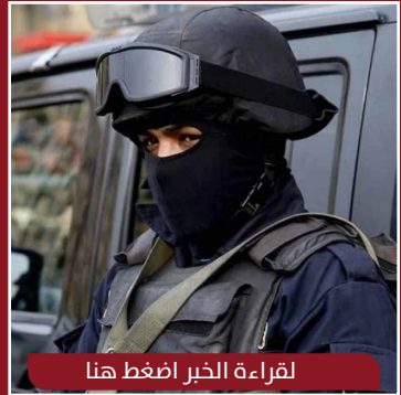
لقراءة الخبر اضغط هنا

سادت حالة من الجدل في مصر بعد العثور على حمير مذبوحة وملقاة على الطريق في مدينة العاشر من رمضان بمحافظة الشرقية شمال القاهرة