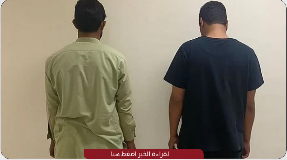
لقراءة الخبر اضغط هنا

أعلنت شرطة منطقة الرياض القبض على شخصين أحدهما مواطن سعودي والآخر مقيم باكستاني، بسبب شجار بينهما على الطريق العام، نتيجة لخلاف على أفضلية السير.