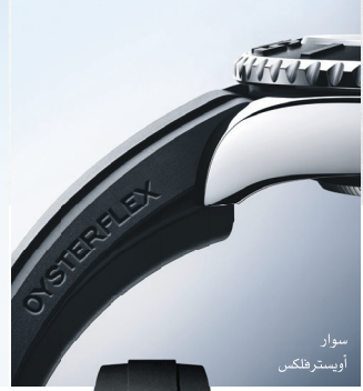
سوار أويستر فلنكس