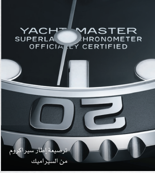
حريمية إطار سيرا كروم من السيراميك