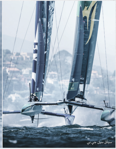
سباق سبيل جي بي