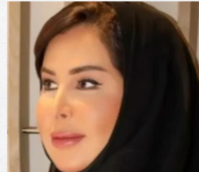
شيخة غانم الكبيسي