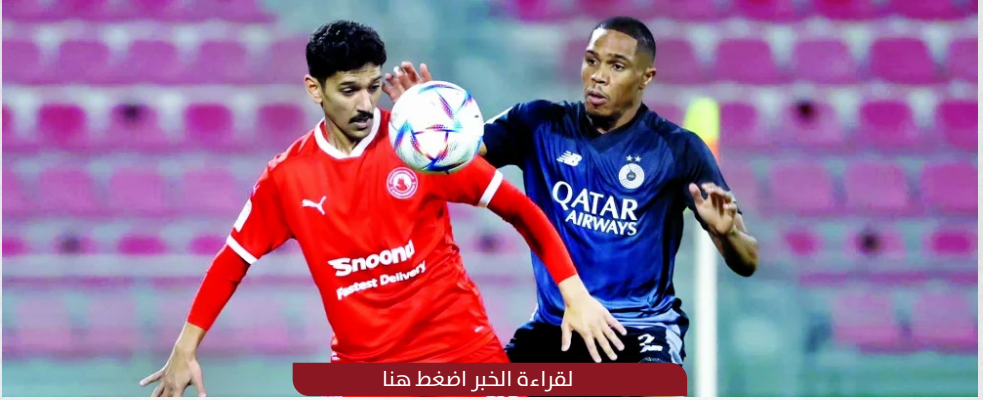
لقراءة الخبر اضغط هنا

حافظ العربي على خطه البياني المتصاعد وضيق الخناق على الدحيل المتصدر في الجولة الخامسة عشرة من الدوري القطري لكرة القدم "دوري نجوم QNB"، محققاً انتصاره العاشر هذا الموسم والثالث توالياً.