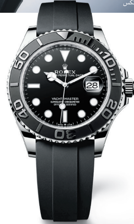
أويستر برينشوال يخت ماستر ٤٢ من الذهب الأبيض عيار ١٨ قيراط