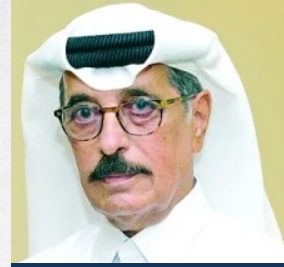
د. حمد بن عبد العزيز الكواري