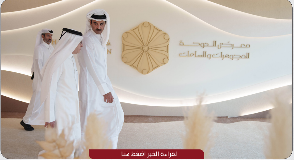
لقراءة الخبر اضغط هنا

قام حضرة صاحب السمو الشيخ تميم بن حمد آل ثاني أمير البلاد المفدى، اليوم، بزيارة معرض الدوحة التاسع عشر للمجوهرات والساعات، المقام في مركز الدوحة للمعارض والمؤتمرات. واطلع سموه، خلال جولته في أجنحة المعرض المختلفة، على أحدث تصاميم المجوهرات والساعات ومشغولات الألماس والذهب والفضة التي صممها الشركات القطرية، وكبرى الشركات العالمية