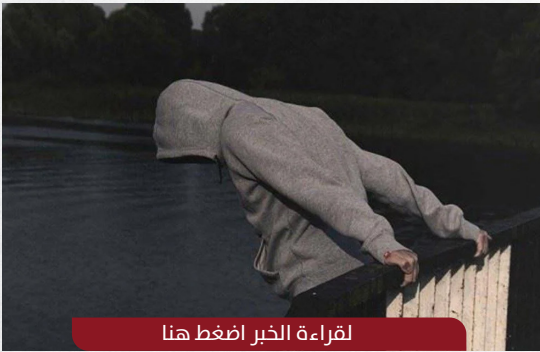
لقراءة الخبر اضغط هنا

في لحظة تحبس الأنفاس، تمكن مجموعة أشخاص من إنقاذ أحد الشباب من الانتحار بعدما تسلق سور أحد جسور مدينة الموصل العراقية، ويظهر في مقطع الفيديو شاب يقف على سور ”الجسر الأول“