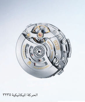
الحركة الميكانيكية ٣٢٣٥