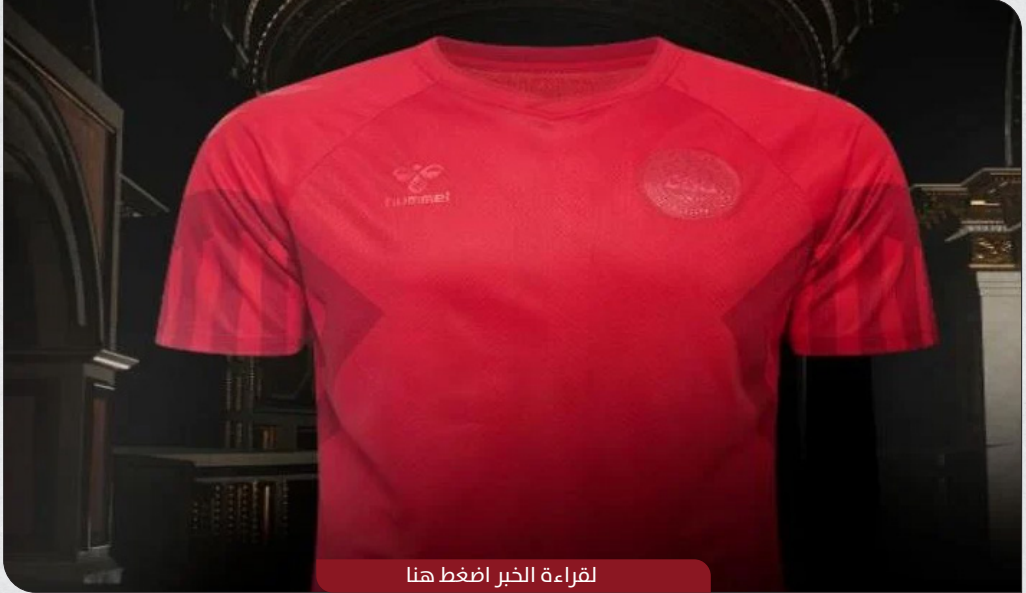
لقراءة الخبر اضغط هنا

رفض الاتحاد الدولي لكرة القدم، طلب منتخب الدنمارك بالسماح لهم بالتدريب بقميص خاص مطبوع عليه جملة "حقوق الإنسان للجميع"، وذلك قبل انطلاق منافسات كأس العالم في قطر، حسب وكالة بلومبرج.