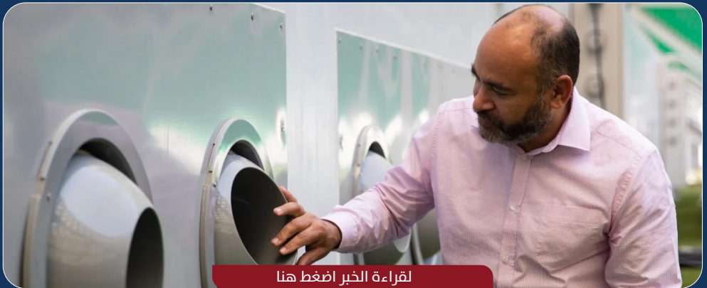
لقراءة الخبر اضغط هنا

تأتي التقنية المتطورة الموفرة للطاقة ثمرة لعلاقة وثيقة بين اللجنة العليا للمشاريع والإرث وجامعة قطر، حيث نجح فريق من كلية الهندسة بالجامعة بقيادة أستاذ الهندسة الدكتور سعود عبد الغني في ابتكار تقنية التبريد، بعد إعلان فوز قطر بحق استضافة المونديال.