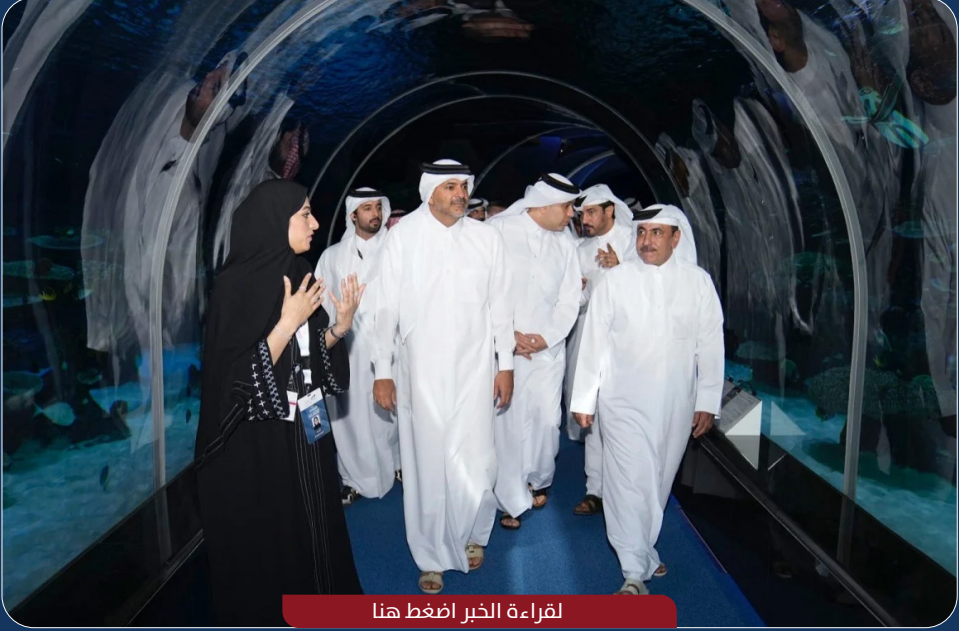
لقراءة الخبر اضغط هنا

افتتح معالي الشيخ خالد بن خليفة بن عبدالعزيز آل ثاني رئيس مجلس الوزراء ووزير الداخلية، اليوم، مركز الزوار بميناء حمد.