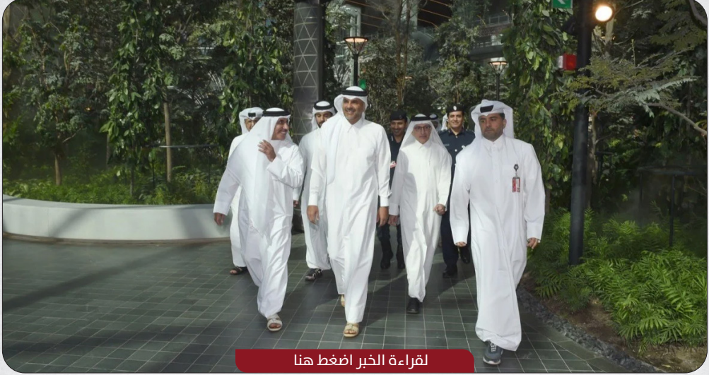
لقراءة الخبر اضغط هنا

افتتح معالي الشيخ خالد بن خليفة بن عبدالعزيز آل ثاني رئيس مجلس الوزراء ووزير الداخلية، اليوم التوسعة الجديدة لمطار حمد الدولي.