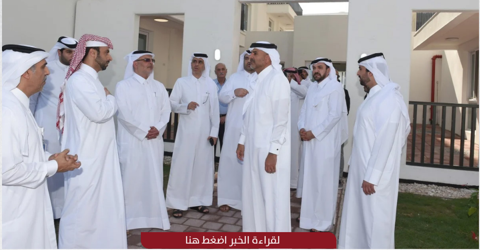
لقراءة الخبر اضغط هنا