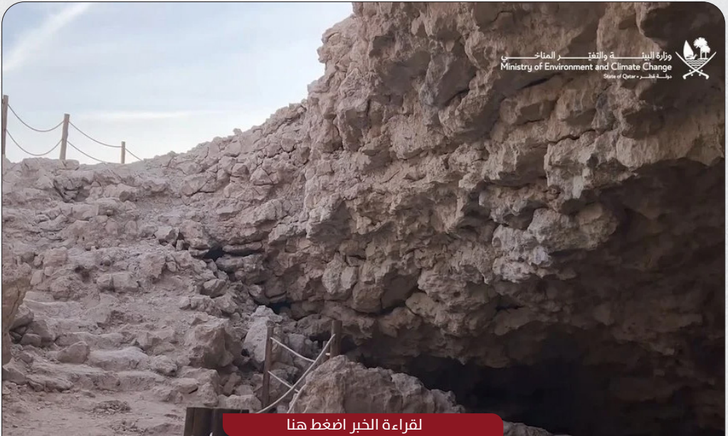
لقراءة الخبر اضغط هنا

افتتح سعادة الدكتور الشيخ فالح بن ناصر بن أحمد بن علي آل ثاني وزير البيئة والتغير المناخي، اليوم، موقع كهف ”دحل المسفر“ في جنوب غرب دولة قطر، والذي يعد من أهم المواقع السياحية البيئية لجذب الجمهور، وذلك بعد الانتهاء من بحث جيولوجي تفصيلي يعد الأول من نوعه للموقع، بالتعاون مع هيئة متاحف قطر وإكسون موبيل للأبحاث.