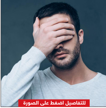
للتفاصيل اضغط على الصورة

كشفت دراسة جديدة عن سبب انتشار الإصابة بالضباب الدماغي (ضعف الإدراك) بين المتعافين من فيروس كورونا وهي الإصابة التي تزايد ظهورها خلال الشهور الماضية في عدد من الدول حول العالم