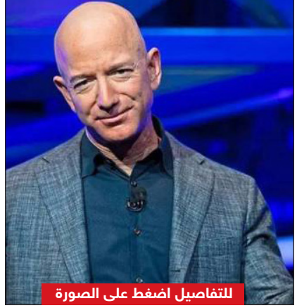
للتفاصيل اضغط على الصورة

خسر أغنياء العالم الأسبوع الماضي نحو 67 مليار دولار من ثرواتهم، إذ انهارت أسهم التجارة الإلكترونية والعملات المشفرة والألعاب عبر الإنترنت، بحسب وكالة بلومبيرغ الأمريكية.