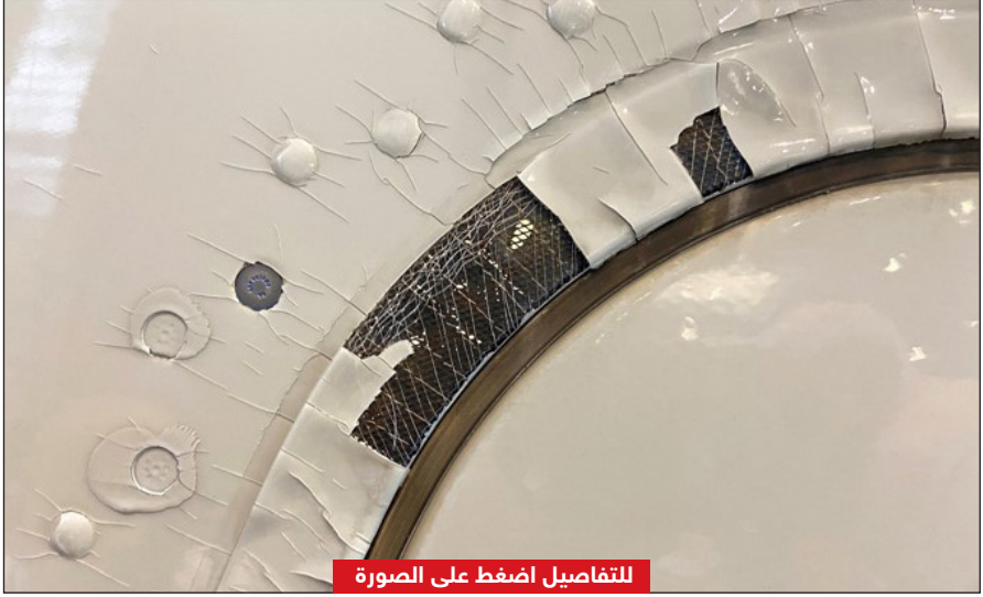
للتفاصيل اضغط على الصورة