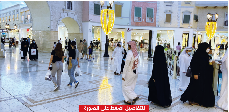
للتفاصيل اضغط على الصورة

المحالين للنيابة 847 شخصاً لم يتقيدوا بارتداء الكمام في الأماكن التي تتطلب ذلك، و760 لم يتقيدوا بالمسافة الآمنة، و31 شخصاً لعدم تحميلهم تطبيق احتراز.