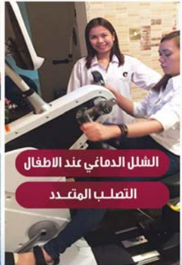
الشلل الدماغي عند الاطفال