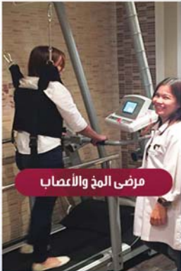
مرضى المخ والأعصاب