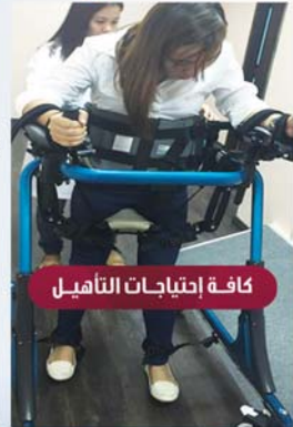
كافة إحتياجات التأهيل