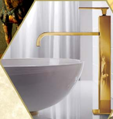
الأدوات الصحية والإكسسوارات