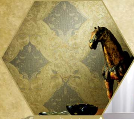
ورق الجدران والأرضيات