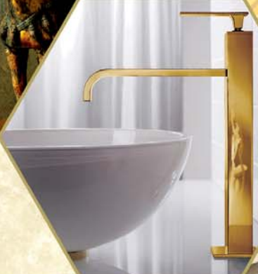
الأدوات الصحية والإكسسوارات