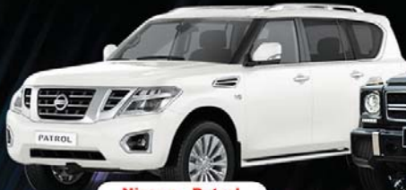
Nissan - Patrol