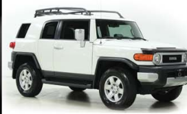
TOYOTA FJ CRUISER 2015