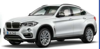
BMW X6 2015