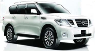
NISSAN PATROL 2015