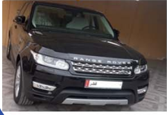
RANGE ROVER SPORT 2015