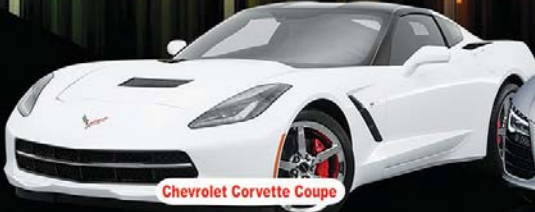
Chevrolet Corvette Coupe

FAST FIVE فاست فايف Rent A Car تاجير السيارات