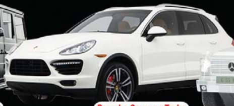
Porsche Cayenne Turbo