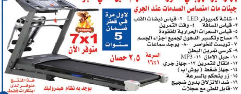
هذا المنتج متوفر لدى ابتكارات فقط يوجد به نظام هيدروليك

نظام تحكم رقمي كامل جينات مات امتصاص الصدمات عند الجري ١- شاشة كمبيوتر LED ٢- قياس نبضات القلب ٣- قياس المسافه ٤- وقت التمرين ٥- قياس السرعات الحراريه المفقوده ٦- مساج وتكسير الدهون لجميع اجزاء الجسم ٧- تويست للخواصر ٨- يوجد سماعات ٩- كرسى تمرين البطن ١٠- حيل الامان MP3 ١٢- اثنال للتمرين ١٢- جهاز جري ١٤- جهاز ضغط (بوش اب) ١٥- زر يتحكم بالسرعه ١٦- ضد الانزلاق بدون ضجيج ١٧- قابل للطي مع عجلات