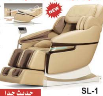
SL-1 حديث جدا

كرسي وسرير مساج اتوماتيكي فاخر متعدد الوظائف باحدث التكنولوجيا - يعمل على تدليك كافة اجزاء الجسم - يعمل على تقليل توتر الاعصاب - التحريك والامتداد على كافة الاوضاع قوي ومتين - يعمل على ثلاث مستويات الارجل والخصر والاكتاف والارداق والظهر - يحتوي على جهاز عرض VFD - سرعه مع ثلاث مستويات قابله للتعديل - ثلاثه اوضاع للاستخدام ثابت وتلقائي بشكل عام وجزئي - كرسى كبسوله مع انعدام الجاذبية - يمكن وضعه في المنازل والفنادق والفلل والمركز الصحيه والصالونات - مصنوع من جلد فاخر ناعم للمس