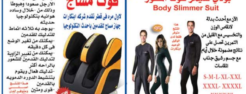
هذا المنتج متوفر لدى ابتكارات فقط

Body Slimmer Suit الآن مع أحدث بدلة لانقاص الوزن والتخسيس مع القليل من التمرين تحصل على نتائج مذهولة خلال أيام مع جسم رشيق جذاب اللقاسات S-M-L-XL-XXL XXXL- XXXXL XXXXXL