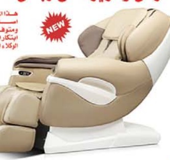
موفر لون اسود / بيج حديث جدا

يعمل على تدليك جميع اجزاء الجسم العنق والكتف والخصر مريح ويعمل على تخفيف الضغط وتوتر الاعصاب - راحه موسع وتقدم لسائقين قوي ومتين - التحكم في السرعه ويجعلك تشعر بالاسترخاء - كرسى كبسوله مع انعدام الجاذبية - يوجد USB استمتع بالموسيقى Mp3