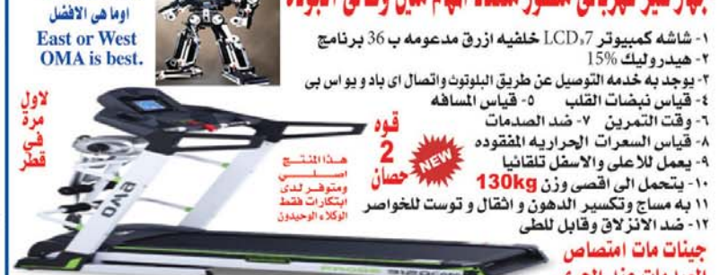
هذا المنتج اصلي ومتوفر لدى ابتكارات فقط الوكلاء الوحيدون

١- شاشة كمبيوتر LCD 7 خلفيه ازرق مدعومه ب 36 برنامج ٢- هيدروليك 15% ٣- يوجد به خدمه التوصيل عن طريق البلوتوث والصال اى باد و يواس بى ٤- قياس نبضات القلب ٥- قياس المسافه ٦- وقت التمرين ٧- ضد الصدمات ٨- قياس السرعات الحراريه المفقوده ٩- يعمل للاعلى والاسفل تلقائيا ١٠- يتحمل الى اقصى وزن 130kg ١١- به مساج وتكسير الدهون و اثنال و توست للخواصر ١٢- ضد الانزلاق وقابل للطي جينات مات امتصاص الصدمات عند الجري