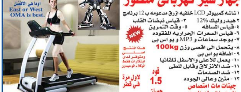
هذا المنتج اصلي ومتوفر لدى ابتكارات فقط الوكلاء الوحيدون

١- شاشة كمبيوتر LCD خلفيه ازرق مدعومه ب 12 برنامج ٢- هيدروليك 12% ٣- قياس نبضات القلب ٤- قياس المسافه ٥- وقت التمرين ٦- قياس السرعات الحراريه المفقوده ٧- يوجد سماعات و MP3 و يواس بى ٨- يتحمل الى اقصى وزن 100kg ٩- اضافه يواس بى ١٠- يعمل للاعلى والاسفل تلقائيا ١١- ضد الانزلاق وقابل للطي ١٢- ضد الصدمات ١٣- متين وعالي الجودة جينات مات امتصاص الصدمات عند الجري