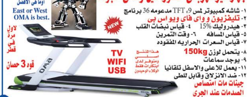
هذا المنتج اصلي ومتوفر لدى ابتكارات فقط الوكلاء الوحيدون

١- شاشة كمبيوتر لمس 9 TFT مدعومه 36 برنامج ٢- تليفزيون وواى فاي ويواس بى ٣- هيدروليك 15% ٤- قياس نبضات القلب ٥- قياس المسافه ٦- وقت التمرين ٧- قياس السرعات الحراريه المفقوده ٨- يتحمل لوزن 150kg ٩- يوجد سماعات ١١- يعمل للاعلى والاسفل تلقائيا ١٢- ضد الانزلاق وقابل للطي جينات مات امتصاص الصدمات عند الجري