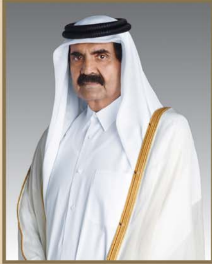
وإلى صاحب السمو الشيخ حمد بن خليفة آل ثاني الأمير الوالد

عيد الفطر السعيد نرفع أسمى آيات التهاني والتبريكات