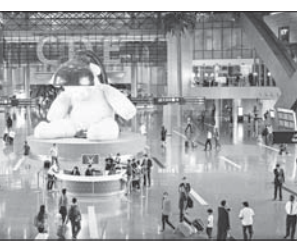
مطار حمد الدولي

المركبة، وتوفير كافة شروط الأمن والمقانة، والتأكد من صلاحية المخبة ورخصة القيادة، وأن تكون المركبة مسجلة باسم المسافر، أو لديه ما يتخوله للسفر بها مع دفتر التريبتك. ويوضح أن المتطلبات الأساسية التي يجب على المواطن المسافر الإلتزام بها هي التأكد من صلاحية جواز السفر، والمراقبين من المواطنين بالسفر إلى دول مجلس التعاون الخليجي بواسطة الجبظة المدنية يجب أن تكون بالبطاقة الذكية فقط، مع العلم بأن الخروج من بلدان دول مجلس التعاون يجب أن يتم بالوثيقة التي تم الحصول عليها بالطبقة أو الجواز وبالعكس، والتأكد جيداً وجود قيود أمنية قبل السفر، والتأكد من مطابقة صورهم، والتأكد من صلاحية جوازات المراقبين من صلاحية الخدمة سواء على الطبقة الذكية سواء المواطنين أو المقيمين عبر خدمة مطراني 2، أو أي من المراكز المختصة المنتشرة في الدولة فهي توفر الوقت والجهد على المسافرين.