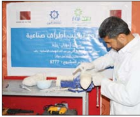
خلال تجهيز الأطراف الصناعية