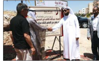
جانب من حضور حفل وضع حجر الأساس

مشروع صحتي الرعاية الصحية الشاملة للاجئين