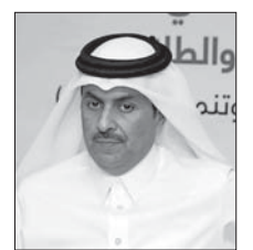
د عبد الله السبيعي

أصدرت الهيئة العامة للطيران المدني العدد الأول من مجلته المخصص سنوية الجديدة «سماة قطر» التي تُعنى بكل أخبار الهيئة وشأناتها ويكفل ما يتعلق بطيران الطيران في دولة قطر، باللغتين العربية والإنجليزية. وقد استقبل العدد بكلمة افتتاحية للسيد طلال الملكي مدير إدارة العلاقات العامة والاتصال في الهيئة ركز فيها على أهمية إصدار المجلة في سبيل إثراء المعرفة والثقافة والفكر في مجال الطيران المدني، وتسليط الضوء على حيوية هذا القطاع وتأثيره على مكونات الاقتصاد الوطني. وتضمن العدد الأول حوار مع سعادة السيد عبدالله بن ناصر تركي السبيعي رئيس الهيئة العامة للطيران المدني، تناول فيه الحديث عن مستقبل قطاع الطيران في قطر وركز على الكثير من المواضيع المتعلقة بالقطاع مثل أسعار تذاكر السفر وسلامة الطيران، كما تحدث عن لائحة القواعد التنظيمية لاستخدام المطارات بدون طيار، وتناول اتفاقيات الهيئة مع مختلف الدول، والعالم واستلم العدد الأول من المجلة على أبواب متنوعة تناولت كافة