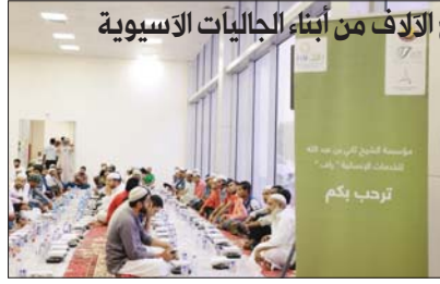
تاكاتب من أبناء الجالية الباكستانية

تنظيمه للعام الثامن على التوالي لصالح الآلاف من أبناء الجاليات الآسيوية