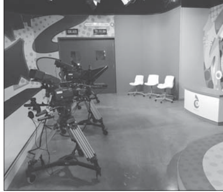
تأ جانب آخر من الاستديو

تختلف مسطحات برامج العيد من عام إلى عام في وسائل الإعلام العربية من إناعات وفصائل وتأتي بكل ما هو جديد من برامج وأعمال ولكننا للأسف نرى الجديد ونسمع الجديد ونعتقد في الأثنين الفرع والمساحات الفرع وحساس العيد وكان الفرع عنصر غائب جاري البحث عنه.