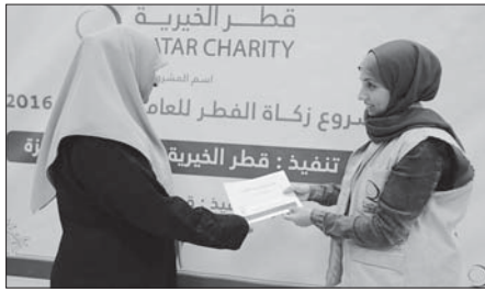
توزيع زكاة الفطر

وعلى نحو متصل قام مكتب قطر الخيرية وعلى قطاع غزة بتنفيذ مشروع زكاة الفطر لصالح 331 أسرة فلسطينية معوزة، وجرى إيداع المبلغ المخصص لكل منها في حسابات الصراف الآلي، ويعد المشروع من المشاريع التكاملية التي تهدف لتخفيف عن كاهل الأسرة الفقيرة وترسيخاً لقيم التعاون على البر والخير. وقد أعدت العائلات التي استفادت من المشروع على أهميتها، لما لها من دور في التخفيف من الأعباء الملقاة على كاهلهم كاسر محتاجة، وعضين أن تدخل السعادة على قلوبهم وقلوب أطفالهم، وتوسع عليهم بمناسبة العيد.