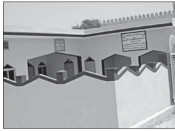
ق مركز عمر بن الخطاب التربوي في باكستان

وتدعم الحفاظ على الهوية والثقافة الإسلامية.