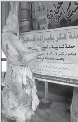
مشروع الأصاحي بتنفيذ حملة فكر بغيرك

وأضاف أن الحملة جاءت كجسر بين أهل الفقراء والأغنياء، مضميناً: «انطلقنا من قوله صلى الله عليه وسلم الدال على