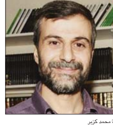
د. محمد فريد

أجمع عدد من مسؤولي المنظمات الإسلامية والأكاديميين البريطانيين على أن موجة العنصرية التي تسربت إلى المجتمع البريطاني تجاه الأجانب والمسلمين المقيمين في بريطانيا، في أعقاب الإعلان عن اختيار بريطانيا الخروج من الاتحاد الأوروبي، قد تفقد نسج المجتمع البريطاني الذي يتسم بالهدوء والتشوق، حيث توجت الشق لتعريف على ما مدى تأثير هذه الموجة العنصرية على واقع المسلمين في بريطانيا، ففكر البروفيسور محمد فريد الشيبال الأستاذ المتفرغ في جامعة لندن البريطانية، للشرق أن موجة العنصرية كانت متوقعة عقب الإعلان عن نتيجة الاستفتاء، خاصة مع الانكماش الاقتصادي الذي يمر به بريطانيا، وهذه الموجة تلتحق في تصاعد وتوسع فيها زيادة الأعباء على المواطن البريطاني العادي جراء زيادة الهجرة الأجنبية التي تضيف أعباء اقتصادية واجتماعية على السوق البريطاني، وتغير من القيم والمثل البريطانية المتعارف عليها. وأشار في حوار مع الشرق قائلا الدكتور محمد فريد الشيبال إن نتيجة الاستفتاء اكتسب اليمين البريطاني أرضا جديدة في المجتمع البريطاني، وتوجه موجة عنصرية إلى المسلمين الآن ليست إلا استمرارا لحالة الإسلاموفوبيا التي خجعت الغرب منذ سنوات، حيث إن الغرب يسعى دائما إلى البحت عن عذو فكان العذو القوي هو الاتحاد السوفييتي وبعد انهياره كان الاتحاد من وجود عذو والمسلمون ليس لديهم تأثير على الحياة السياسية في الغرب بشكل عام، ونظر لعدم وجود قانون يجرم العنصرية بسبب الدين هناك المسلم أفضل نموذج ليكون عدوا للغرب، ومن هنا برزت حالة الإسلاموفوبيا في الغرب، وعن الدور المطلوب لحماية المسلمين من حالات العنصرية التي تقع في بريطانيا والغرب قال الدكتور محمد فريد الشيبال للشرق: أولا: لابد من تشريع قوانين