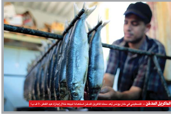
الماكزيل المدخن .. فلسطيني في خان يونس يُعد سمك الماكزيل المدخن استعداداً لبيعته خلال إجازة عيد الفطر... (أ ب)