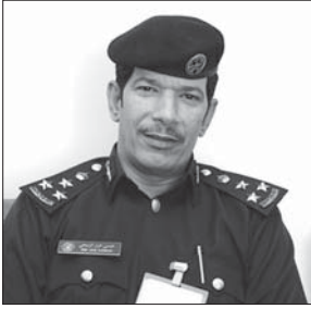
العميد عيسى عرار الرميحي

في بلد آخر بهدف تجديد النشاط وإدخال البهجة والسرور في النفوس. بعد عام من العمل وهو ما يتطلب الاستعداد الجيد لهذه الرحلة وأخذ بعض الاحتياطات التي تتعلق بالجوازات والتأشيرات ووسائل الأمن والسلامة في الحافلات