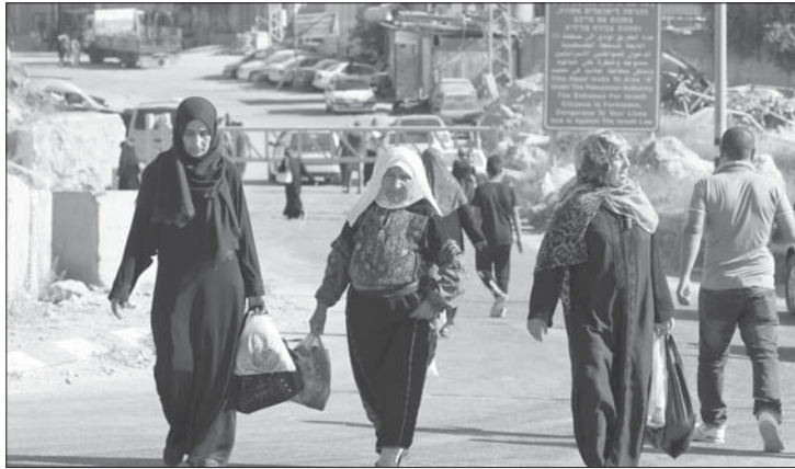
فلسطينيات يعبرن بعد يوم لمد حواجز جنوب الخليل

عممتها عبر مواقعها الإعلامية المتنوعة، أن اقتحامات يوم غد ستكون انتقاماً لمقتل مستوطنة من كريات أربع في الخليل بالضفة الغربية.