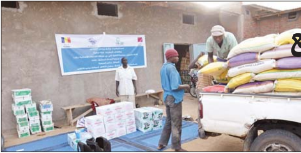
ت خلال تجهيز السلال الرمضانية