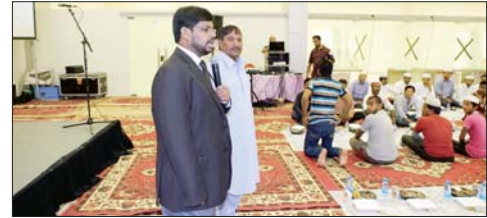
تاكاتبون يتابعون محاضرة عن السلامة المرورية