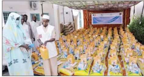
تارة أسرة تتسلم السلة الرمضانية المخصصة لها

وتشاد تتميز بمظاهر متنوعة في شهر رمضان المبارك، فالمسلمون التشاديون يستعدون لرمضان قبل حلوله بحوالي شهرين، حيث يصوم الكثيرون شهري رجب وشعبان كاملين والبعض الآخر يصوم أياماً من رجب. وتشهد تشاد عادة لا تحدث في أي دولة أخرى هناك، حيث يقوم الأطفال ببناء مساجد