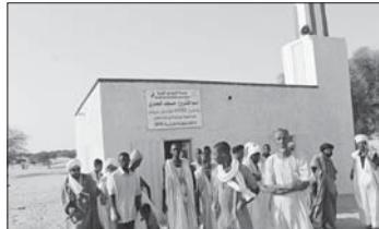
ق أمالي مورتيا يفتتحون مسجداً

وجاءت مشاريع المياه في المرتبة الثانية من حيث القيمة الأولى من حيث العدد الذي بلغ 309 آبار ويراد بتكلفة 1.457.345 ريالاً، حيث سعت المؤسسة لتأمين مياه الشرب للناس في عشرات الدول من خلال مشاريع المياه بحفر الآبار وتأمين المياه النقية الصالحة للشرب لعشرات الآلاف من السكان الذين لا يجدون سبيلاً لتوفير المياه اللازمة للشرب والاستخدامات المنزلية فضلاً عن استخدامها في الزراعة وتربية الماشية وكثير من الاستخدامات المنفعة التي تحتاج جميعها للماء، قال الله: وجعلنا من الماء كل شيء حي، وساهمت هذه الآبار في حل جزء كبير من مشكلات نقص المياه وندرتها وتوفر مياه الشرب السري والتخفيف على الناس مشقة الحصول على الماء.