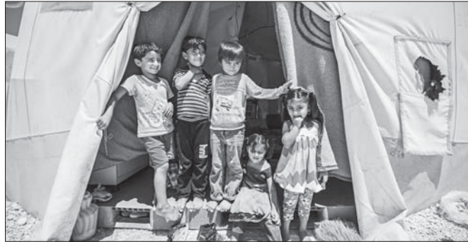
اللاجئون السوريون في المخيمات التركية يستعدون لاستقبال عيد الفطر

العيد يعني أن تكون معاً، أما نحن فبعبودين عن منزلنا وأقاربنا، مضى علينا وقت طويل ونحن هنا، لقد تعودنا على المكان، لا تزال نجهز لعيدنا.