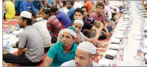
تاكاتبون يتابعون محاضرة عن السلامة المرورية

اختتمت مؤسسة الشيخ ثاني بن عبدالله للخدمات الإنسانية «راف» مشروعها الرمضاني «إفطار وإخاء» الذي تنظمه للعام الثامن على التوالي وتستضيف خلاله الآلاف من أبناء الجاليات المقيمة في قطر، وقد استضافت منه هذا العام 4 جاليات آسيوية هي الجالية النيبالية