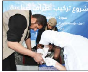
خلال أخذ القياسات من أحد المصابين