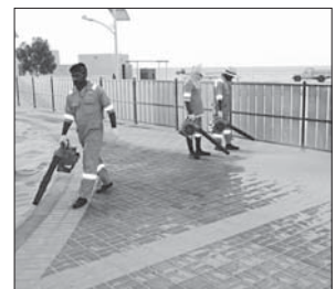
ق خلال تنظيف شاطئ الخوازيج