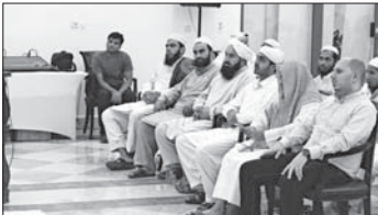
ق جانب من الحضور

وتابع المحمود حديثه في أن الدين مسؤولية ولا يتكفي بكونه مولود مسلم وأنه أمر مسلم به، بل عليه أن يسعى لتكون شهادة أن لا إله إلا الله وأن محمداً رسول الله، هي منهاج حياة، ولا بد من إقرار الإيمان بالفضل، فإله عز وجل قال: الذين آمنوا وعملوا الصالحات فالعمل لأجر من لوازم الإيمان، وركنه الذي يقوم به بالكتابة، لا بد من ترجمة عملية مقتضيات الشهادة.