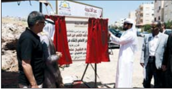
خلال وضع حجر الأساس للمشروع