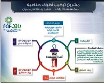
انفوجرافيك حول مشروع «راف» لتركيب أطراف صناعية

من معاناة المتكسبين والمتضررين من أبناء الشعب السوري ومعالجة الأهم وأجراً لهم، وذلك من خلال تنفيذ مئات المشاريع في المجالات المختلفة خاصة المشاريع الطبية. وبلغت المساهمات في دعم الخدمات الصحية في العديد من الأنشطة المقدمة للاجئين والمهاجرين عام 2015 حوالي 17 مليوناً و300 ألف ريالاً، والتي من أهمها العيادة القطرية الصحية بخمير الزعترى، ومشاريع الرعاية الصحية المتنوعة داخل سوريا، ومنها تصنيع الأطراف الصناعية، والمستلزمات الطبية، والدعم للقطاع الطبي في لبنان وسوريا وتركيا، وتوفير الأدوية والمستلزمات الطبية الضرورية.