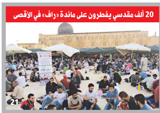
20 ألف مقدسي يفطرون على مائدة «راف» في الأقصى