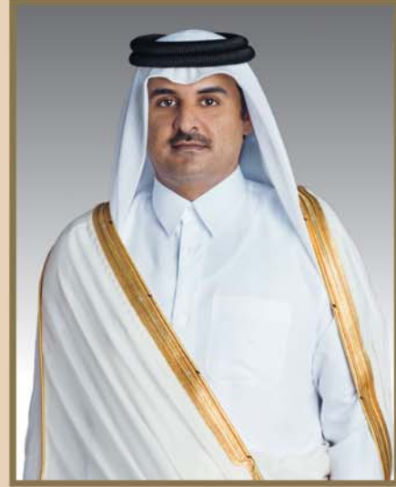
إلى مقام حضرة صاحب السمو الشيخ تميم بن حمد آل ثاني أمير البلاد المفدى