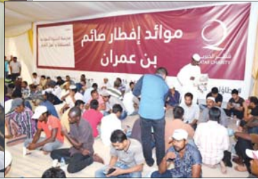
موائد الإفطار في بن عمران