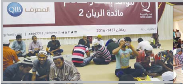
موائد الإفطار في الريان