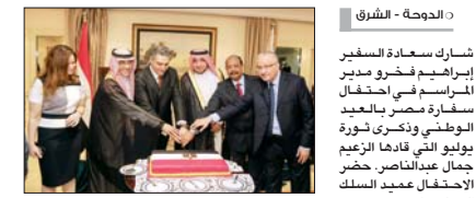
تفخرو والسفراء خلال الاحتفال

شارك سعادة السفير إبراهيم فخرو مدير المراسم في احتفال سفارة مصر بالعيد الوطني وتكري ثورة يوليو التي قادها الزعيم جمال عبدالناصر. حضر الاحتفال عميد السلك الدبلوماسي وعدد من سفراء الدول العربية والأجنبية بالدوحة، والتي الدكتور ايهاب عبدالحميد القائم بالأعمال المصري بالإنابة كلمة في الاحتفال، أعرب فيها عن شكره لدولة قطر وشعبها الضيفاء، مؤكداً أنه تجتمع بالشعب المصري