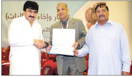
تاكريم ممثلي الجالية الباكستانية