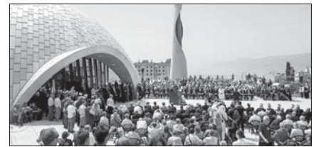
ك المركز الإسلامي في كرواتيا