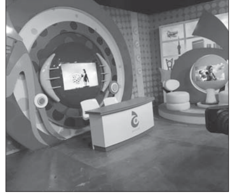
تأ من أستوديو تلفزيون ج في مدينة كيدزانيا جدة

والإضاءة والديكور والإكسسوارات التي تجعله خلال فترة وجيزة من انطلاقه، لقد عمل تلفزيون ج طوال السنوات الماضية على وضع خطط تطوير كل ما يقدمه معتدًا في ذلك على المعلومة المجددة والترفيه السلي وهو اليوم من خلال هذا الاستديو يخطو خطوات مهمة تجعل الطفل يتجاوز مرحلة التلقي ليكون جزءًا فاعلًا في كل ما يقدم له من برامج، هذا التحول المهم في العلاقة بين الطفل والتلفزيون سيحل من تلفزيون ج راشدًا في إيصال رسالته لجعل أستوديو ج الأطفال جزءًا من عملية الإنتاج التلفزيوني، إذ تشمل التجربة الجانب التثقيفي التوعوي والجانب التعليمي، ويختبر التفاعل الكبير الذي تحظى به برامج تلفزيون ج في أوساط