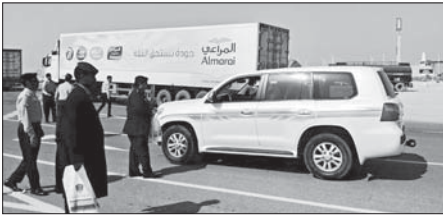
رحلة توعوية على متنق أبو سمرة الحدودي

يتوجه الآلاف من المواطنين والمقيمين خلال الإجازة الصيفية إلى منافذ الدولة البرية أو الجوية للسفر لقضاء فترة الإجازة