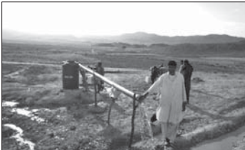
ق آبار يستعان بها في العمل الزراعي

وساهمت المؤسسة في دعم 3 مشاريع إنشائية من خلال بعض المساهمات المالية التي بلغت نحو 60 ألف ريال، لدعم هذه المشاريع واستكمال إنشائها.