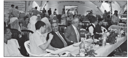
ك جانب من حفل الإفطار