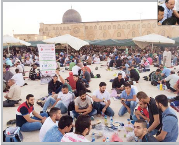
لا جانب من مأدبة راف في المسجد الأقصى

مؤسسة الشرق التي بنى الله الخدمات الإنسانية Raf Foundation