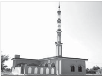
مسجد بنى علي نفقة أحد الحسينين

الإيمان ويستمر عورات النساء والأطفال لهذه الأسر المتعطفة التي كانت بلا مأوى، ولم تجد المسكن الذي يؤوي أفرادها.