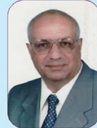
ترخيص رقم ٥٨٢٣

استشاري أمراض الاطفال وحديثي الولادة علاج أمراض الهضم - أمراض الصدر أمراض الغدد - علاج اضطرابات النمو والنطور عند الأطفال علاج أمراض الكلية والسلس البولي