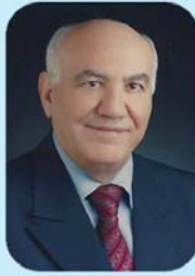
ترخيص رقم ٩٤٥