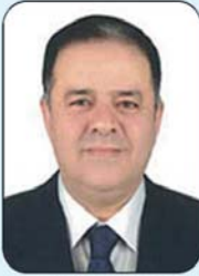
ترخيص رقم ٩١٧٣