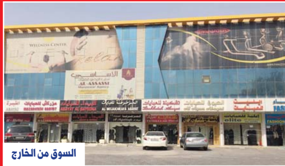
السوق من الخارج