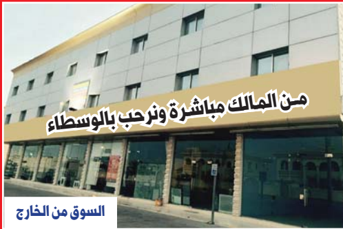
السوق من الخارج